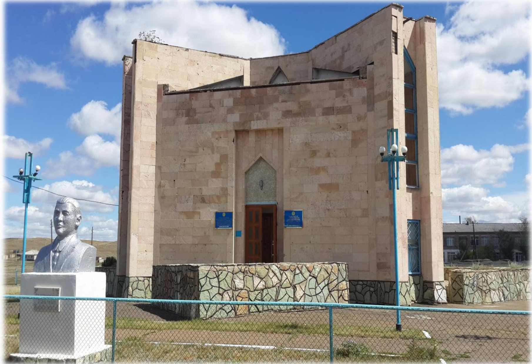
Сұлтанмахмұт Торайғыров мұражайы