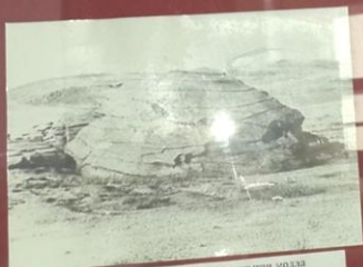
Мұқтарұлы ауылындағы Сұлтанмурат одаған мола медресесінің жанындағы кайт-үй торабас тас.